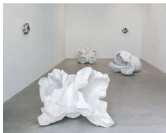
Pae White, Demimondaine , veduta della mostra, 2017

Il titolo della mostra prende origine all'espressione francese "demi-monde" o "mondo di mezzo", spesso utilizzata all'inizio del XX secolo per descrivere chi manteneva uno stile di vita opulento e volto alla ricerca del piacere. Il lavoro di White si avvale di tecnologie avanzate, così come della collaborazione di esperti artigiani, con l'obiettivo di enfatizzare i limiti e le complessità di entrambi gli ambiti, e di scardinare la linea di confine tra funzionale e decorativo.